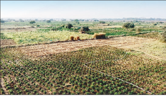
हरिभूमि न्यूज ▶▶ रायगढ़

यह हरियाली घास और अन्य पौधों की नहीं, हरी सब्जियों की खेती है और यह हरी मोती कुछ और नहीं बल्कि तरबूज, मिर्च, बैंगन, आलू, टमाटर, गोभी और अन्य कई तरह की सब्जियां हैं। जिसकी खेती जैसे-जैसे महानदी का पानी कम होते जाती है वैसे-वैसे इसकी एरिया बढ़ती जाती है। मोटा-मोटी डेढ़ से दो सौ एकड़ में पुल के नीचे खेती होती है। अमूमन नदी के तटों पर बसे दो चार गांव के लोग एक दो एकड़ में साग-भाजी