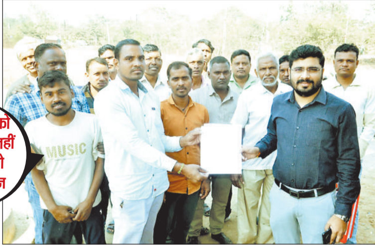
तहसीलदार को ज्ञापन सौंपते किसान नेता।

तहसीलदार को सौंपा ज्ञापन, नहीं मिली खाद तो होगा आंदोलन